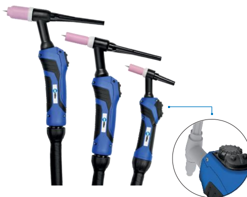
*dálkové ovládání je možné dodat

Hořáky Miller TIG byly navrženy tak, aby dokonale požadavkům svářečů a aby svářeč mohl plně těžit z vynikající kvality oblouku Miller Syncrowave®. Materiál byl pečlivě vybrán, aby se zabránilo stárnutí a úniku v hadicích a kabelech. Společnost Miller používá více mědi v proudovém kabelu k minimalizaci ztrát a maximalizaci výkonu. Hořáky TIG lze konfigurovat se standardní hlavou hořáku nebo flexibilní alternativou. Ergonomickou rukojeť lze také vybavit dálkovým ovládním pro nastavení svařovacího proudu přímo z hořáku. Hořáky jsou standardně vybaveny 2,4 mm wolframovou elektrodou Miller® | Weldcraft® 2% lanthan. Modrá elektroda zajišťuje stabilní oblouk v procesech střídavého i stejnosměrného proudu, s delší životností než ostatní wolframové elektrody.